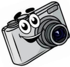
Photo sur réseaux sociaux